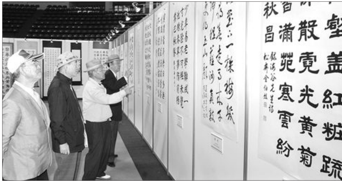
전국노인서예대전 19일 광주 구동실내체육관에서 열린 '제5회 전국노인서예대전'을 찾은 관람객들이 작품을 감상하고 있다.

11월 초 합격자 발표 광주대는 2008년도 수시 2학기 2차 원서접수를 마감한 결과 255명 모집에 749명이 지원해 2.94대 1의 경쟁률을 기록했다고 19일 밝혔다. 이는 지난해 경쟁률(394명 모집에 416명 지원) 1.06대 1에 비해 3배 가까이 높아진 것이다. 가장 많은 지원자가 몰린 곳은 일 반학생 전형 유아교육과로 6명 모집에 149명이 지원, 24.83대 1을 기록했다. 작업치료학과(14.67대 1), 스포츠 레저학부(12.5대 1) 등이 뒤를 이었다. 합격자 발표는 오는 11월22일이다.