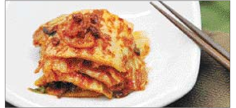
▲구기자 김치=절인 배추에 양념(고춧가루, 참살풀, 말치액젓, 북어, 다시마, 구기자, 마늘, 양파 등을 넣어 만든 육수에 생강, 설랑을 넣는다)을 넣고 버무린 뒤 실온에서 하루 숙성한다.