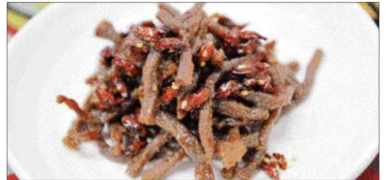
▲구기자 장떡볶이=①쇠고기를 가늘게 채썬 다음 구기자와 다시마 우린물을 넣고 불고기 양념한다 ②팬에 불고기 양념한 쇠고기와 구기자를 넣고 조리낸다.