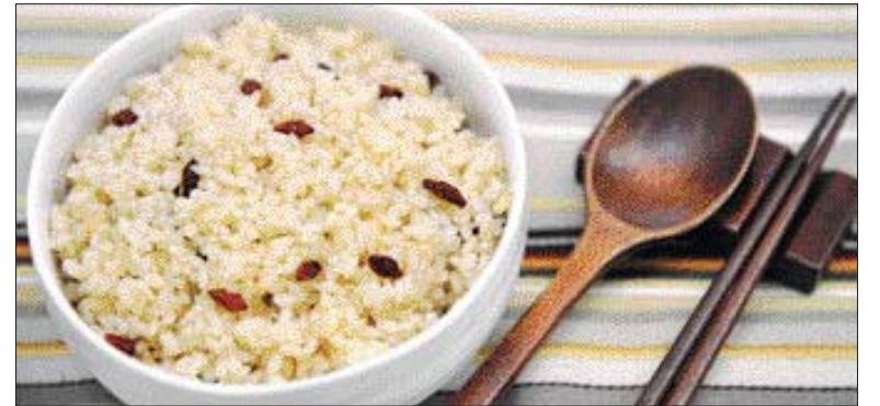
▲구기자 밥=①쌀과 찰쌀을 5:1 비율로 섞은 뒤 씻어 채에 받쳐 30분 가량 둔다 ②구기자와 구기자 우린물을 넣고 밥을 짓는다.