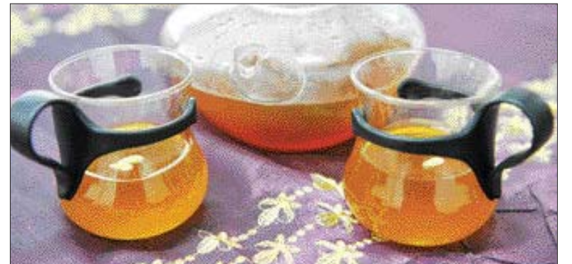
▲구기자차=대추와 생강, 구기자를 은근한 불에서 끓여 꿀을 넣은 뒤 차를 띄운다.