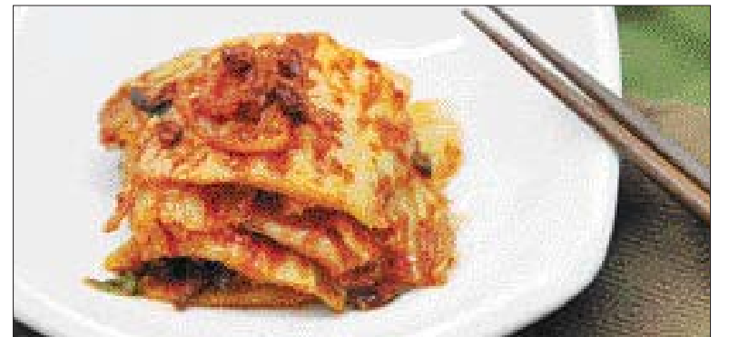
▲구기자 김치=절인 배추에 양념(고춧가루, 찹쌀풀, 말치즈, 북어, 다시마, 구기자, 마늘, 양파 등을 넣어 만든 육수에 생강, 설랑을 넣는다)을 넣고 버무린 뒤 실온에서 하루 숙성한다.