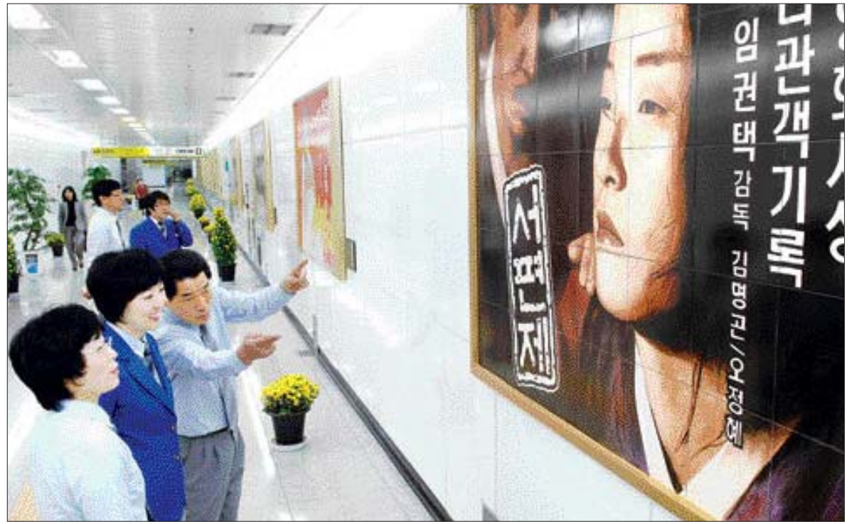
광주지하철 금남로 5가역에 조성된 '추억의 영화거리'에서 시민들이 옛 한국영화 포스터를 감상하고 있다.