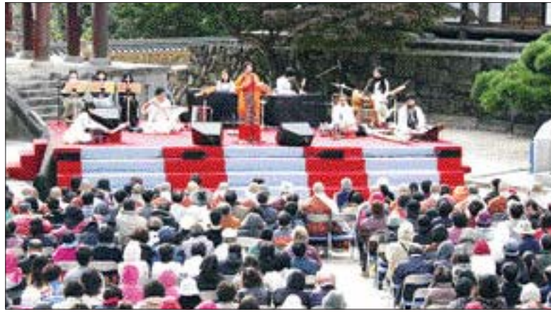
화엄사 영성음악제 지난 20일부터 이틀간 구례 화엄사에서 불교신도와 주민, 관광객 등 1천여명이 참석한 가운데 '제 10회 서편제 보성소리 축제'를 주제로 '2007 국제영성음악제'가 개최됐다. 영성음악(Spiritual music)은 불교 법파나 토속 신앙의 굿 등 지어진 자유력을 일깨우는 연주를 의미한다.

이들 5개 영역에 대한 분석 결과, 목포·순천·강진의료원은 각각 69점·65.9점·62.6점으로 70점을 모두 밑돌아 종합평점 'C'에 그쳤다. '양질의 의료 영역'에서는 목포의료원만 75%로 평균(71.7%)을 웃돌았을 뿐, 강진의료원과 순천의료원은 각각 71.2%와 69.1%로 평균 총점을 하회했다. 합리적 운영 부문에서도 전체 평균 총점이 58.8%였으나 목포의료원(51.3%)·강진의료원(55%) 등은 그에 미치지 못했다. 공공의료기관의 대표적 기능인 의료취약계층에 대한 의료 안전망 제공 기능에 있어서도 ▲목포만 75.4%를 기록했을 뿐 ▲강진(63.3%) ▲순천(52.1%)의료원은 낮은 총점을 나타냈다. 장 의원은 "거점 공공병원의 효율성을 높이기 위해 중앙정부와 지방정부의 지원이 필요하다"고 강조했다. /최권일기자 cki@kwangju.co.kr