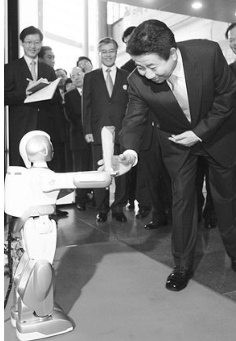
노태통령과 로봇 노무현 대통령이 25일 서울 삼성동 코엑스 인도양홀에서 열린 ‘미래성장동력 2007 전시회’에 참석, 입구에서 로봇으로부터 정미를 선물받고 있다.