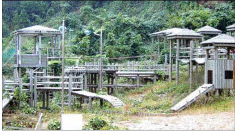
목포시가 지난 2003년 부주산 일대에 조성했던 어린이 극기체육 부지에 주차장을 조성할 계획이어서 예산 낭비라는 지적이 일고 있다.

이에 대해 목포시의회는 "조성된지 4년도 안된 어린이 극기 훈련장을 허물고 이곳에 30억원을 들여 주차장을