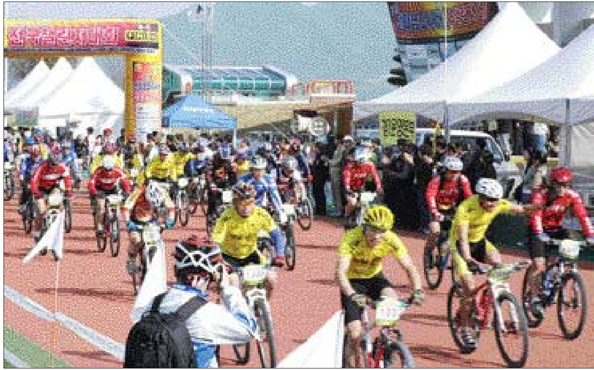
전국 산악자전거 대회

영암군 군서면 왕인박사 유적지 일대에서 29일부터 11월 7일까지 ‘풍성한 가을, 추억과 낭만이 있는 축제’를 주제로 왕인국화축제가 열린다. 이번 국화축제에서는 군 농업기술센터에서 직접 재배한 대국과 소국, 현애국, 분재국 및 영암국화동호회원 출품작 610점 등 국화 5만여점이 전시된다. 이밖에 국화차 시음장과 국화를 이용한 음식(떡, 화전) 체험장, 농특산물 전시관 매점 등 체험 프로그램이 운영된다. /영암=김한림기자 hnkim@