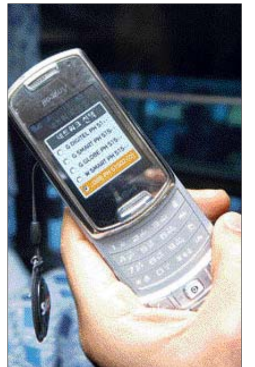
필리핀 일부 지역에서는 네트워크 설정 변경을 통해 영상 통화가 가능한 주파수를 선택해줘야 한다.

화를 걸 때, 한국에서 전화가 걸려올 경우, 필리핀 현지에서의 통화 요금이 모두 다르다.