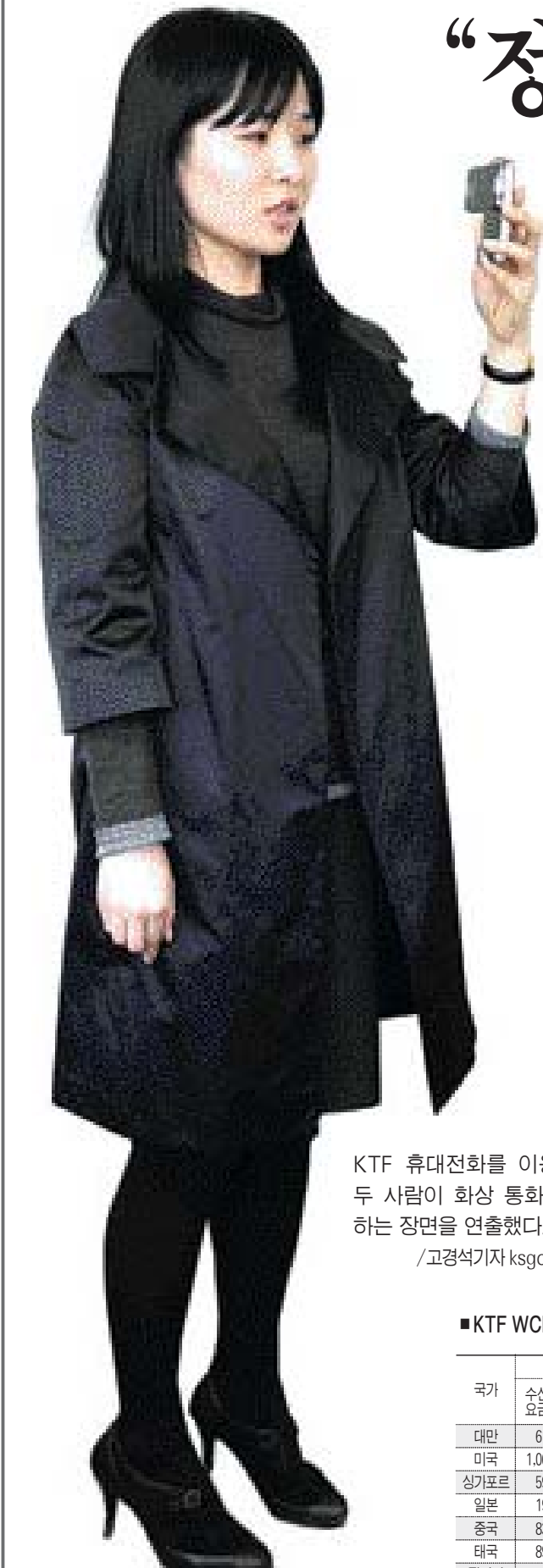
KTF 휴대전화를 이용, 두 사람이 화상 통화를 하는 장면을 연출했다.

‘한국에서 쓰는 휴대전화를 가지고 해외에서 그대로 쓸 수 있다. 문자 메시지를 보내고 또렷한 목소리에 선행한 모습까지 생생하게 전해준다.’ 통신사들은 ‘글로벌 로밍(Global roaming)’으로 편리해졌다고 하지만 일반 소비자들엔 먼 얘기처럼 들린다. KTF 광주마케팅본부에서 글로벌 로밍이 가능한 HSDPA 휴대전화를 빌려 직접 해외로 가져가 써봤다. 체험 제품은 삼성전자의 ‘SPH-W2400’. 해외에 들고 나갔을 때 자동으로