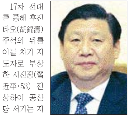
17차 전대를 통해 후진타오(胡錦濤) 주석의 뒤를 이을 차기 지도자로 부상한 시진핑(習近平, 53) 전 상하이 공산당 서기는 지난 3월 상하이 시를 맡은 이후 상하이의 성장동력을 유지하면서 부패척결에 힘을 쏟은 공로를 인정받았다.

전대(全大)는 5년마다 열리는 중국 공산당의 전당대회로 당의 최고 통치기구입니다.