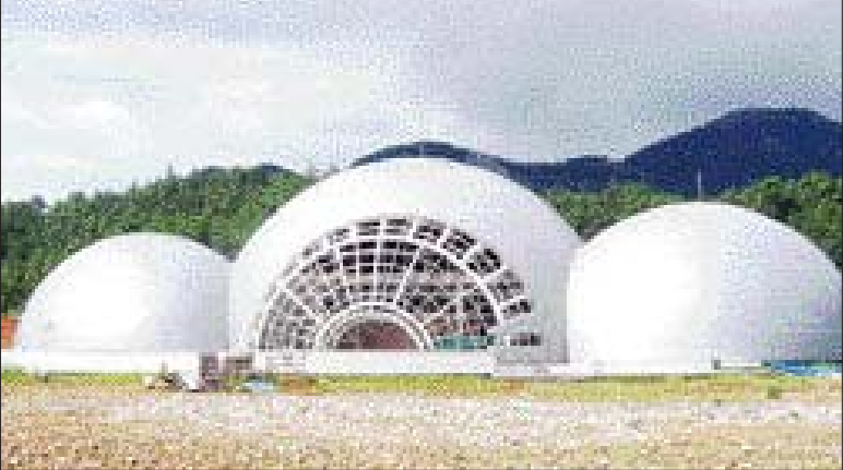
오는 2010년까지 보성군 특량면에서 공룡알 형태의 전시관 등을 갖춘 비봉공룡공원이 조성된다

근무 후 복직 시켜줄 것을 주장해 왔다. 이와 관련, 민주노총 전남본부는 지난달 31일 "해고자 문제가 대화와 타협을 통해 평화적으로 해결되길 바랐으나 GS 칼텍스 측이 기존 입장을 고수해 협상이 결렬됐다"고 비난했다. 반면 GS 칼텍스 측은 "법원이 2004년 불법 파업을 주도한 근로자들에 대한 해고가 정당하다는 판결을 내린 바 있다"며 "최대한의 양보안을 제시했는데도 민주노총 측에서 받아들이지 않았다"고 말했다. /여수=박양규기자 ykpark@