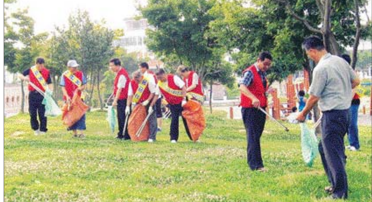
장애우들도 엑스포 유치 한몫 여수지역 장애우들이 2012여수세계박람회의 성공적 유치를 위해 청결, 질서, 친절, 봉사 등 엑스포 4대 시민운동 실천에 앞장서고 있다. (사)전남신체장애인복지회 여수지부 '장애인 한마음봉사단'은 매일 한차례 시민들의 휴식공간인 여수 엑스포공원 일대에서 청결활동을 펼치고 있다.