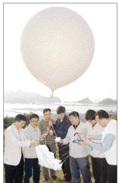
광주지방기상청 측신도 기상대 직원들이 고층기상관측을 위해 GPS센서를 이 헬륨 풍선에 대달아 띄워올리고 있다.