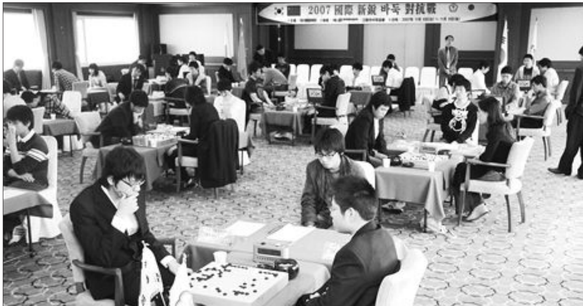
한·중·일·대만 4개국 신예기사들이 지난 8일 강원도 강릉에서 열린 제11회 국제신예대항전에서 대국하고 있다.