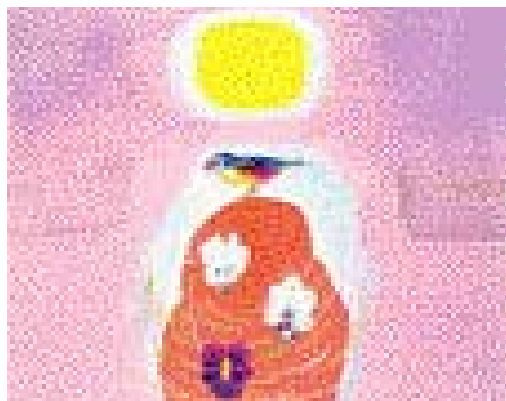
진원장 작 'Shake I'

광주시향 - 창단 31년만에 내달 첫 해외 나들이 김미숙 하나무용단 - 미·일서 한복 패션쇼·전통 춤 공연 국악실내악단 도드리- 멕시코에 우리가락 선사 미술인들도 상하이·도쿄 아트페어 참가 잇따라