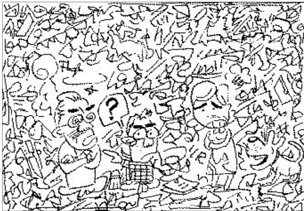
찾아보세 요 서울목, 부영칼, A자, 음표, 바늘, 열대어, 우리나라 지도, 펜촉, 종이배