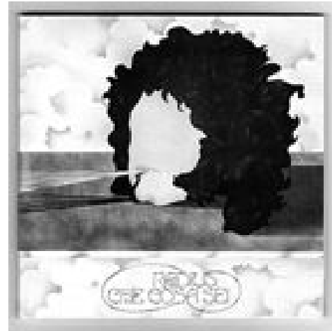
'라디우스, 케 코사 세이'

지난달 15일 KBS 2FM의 '전영혁의 음악세계'가 큰 맥을 내렸다. 86년에 시작했으므로 21년의 세월을 늦게 잡 이루지 못한 음악 애호가들의 친구가 되어 주었던 음악 전문 프로그램이었다.