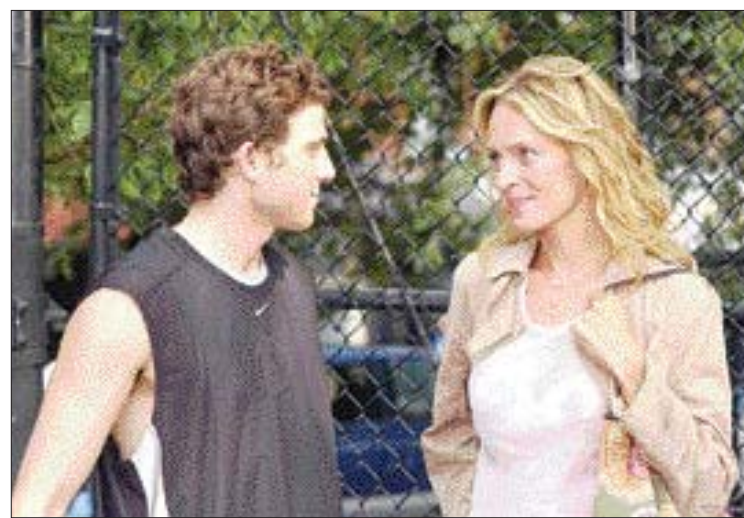
이질적인 성별을 갖고 있는 남·녀의 성에 대한 인식이 발생하는 것은 서로 다른 유전자의 특성과 진화생물학 등 인간의 행동을 결정하는 다양한 요소가 작용하기 때문이다. 영화 ‘프리미 러브’.

적잖은 남성들이 부인이나 사랑하는 사람에게 헌신적으로 대한다고 믿고 있으나, 정자는 태생적으로 여성을 믿지 않는다고 한다. 장기간 집을 비운 남성의 경우 정자의 생산량이 평소보다 30% 가량 증가한다. 여성의 몸에 침입한 또 다른 정자와 싸우기 위해서다. 이유는 알 수 없지만 정자가 미식축구 선수처럼 난자와 만나야 하는 주장 선수를 보호하기 위해 본능적으로 증원군을 늘린다는 것이다. 진화생물학에서는 이런 관점에서 영장류 수컷의 고환의 크기를 결정하는 중요한 요소는 제각기 이외의 상대와 비람을 피우는 생의교미와 밀접한 관련을 맺고 있다고 본다. 결혼상태를 까다롭게 고르는 여성들의 심리에 대한 힌트는 히말라야 원숭이 암컷에게서 얻을 수 있다. 히말라야 원숭이는 본능적으로 무리의 우두머리를 차지하는 어린 수컷을 알아본다는 것이다. 이는 장차 태어날 새끼들의 생존을 보장해줄 음식을 제공할 수컷을 알아보는 능력이 발달된 결과다. 심리학자 데이비드 M. 버스가 37개 문화권 여성들을 대상으로 실시한 설문에서 여성들이 하나 같이 장래 배우자감의 지위와 경제력을 첫째로 꼽은 이유도 이와 무관하지 않다는 것이다.