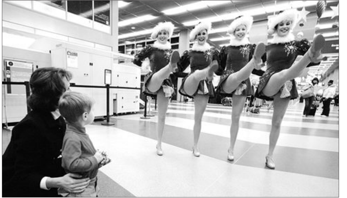
“우리 보며 무료함 달래세요”

인도적 문제의 실질적 해결을 위해 남북자·국군포로 문제 해결 등을 세부 추진과제로 정했으며 특히 여건이 성숙될 경우 남북자·국군포로 사망자의 유골 송환을 추진하기로 했다.