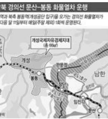
남북 경의선 문산-봉동 화물열차 운행. 남측의 문산역과 북측 봉동역(개성공단 입구)을 오가는 경의선 화물열차가 다음 달 11일부터 매일(주말 제외) 1회씩 운영된다.

통일부 당국자는 “아직까지는 매일 실어나를 만한 물량이 없는 것이 사실이지만 수요를 창출한다는 차원