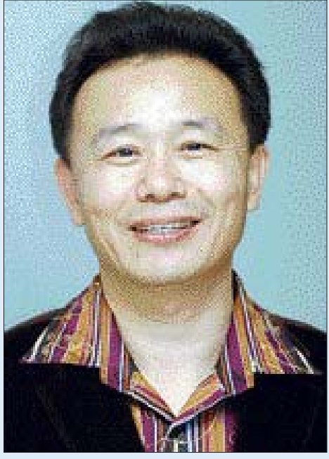
광주 노래꾼 100여명 무료봉사 수익금 6억5천만원 불우시설에