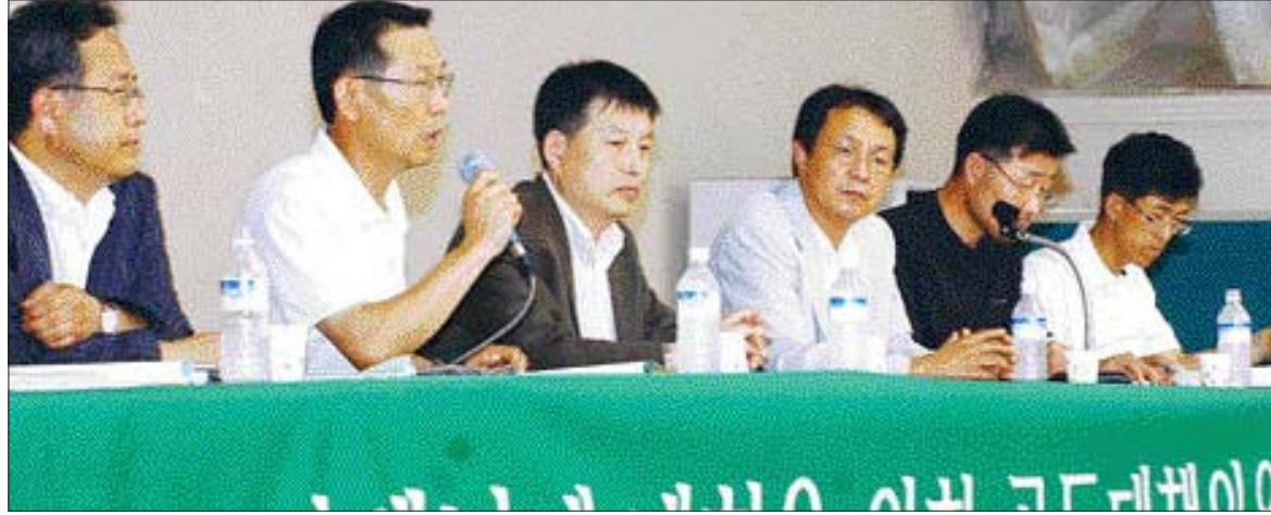
지난 7월 열린 광주비엔날레 개혁을 위한 공동대책위 기자회견.

이와 함께 재단은 제2개편안으로 이사장 직제를 단일화한 뒤 민간 경영전문가에게 재단 운영을 전적으로 맡기는 '민간 책임경영제' 도입을 검토하고 있다.