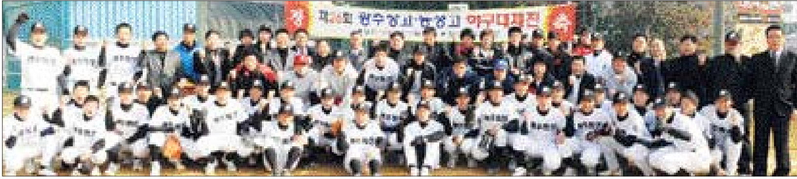
9일 광주 동성고에서 열린 '제 26회 동성고 야구 대제전' 행사에 참석한 동성고 출신 야구 선·후배들이 행사에 앞서 파이팅을 외치고 있다.