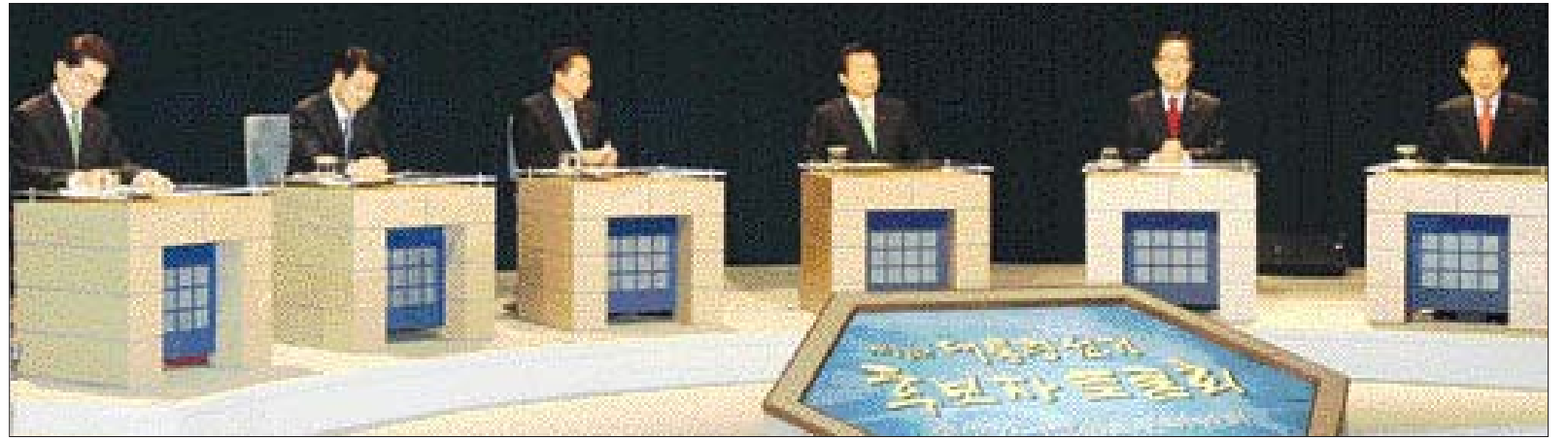
대선 후보 토론

히 달성할 것으로 보인다. '후라 포토닉스'도 KT를 비롯해 국내·외에 FTH 몰람 공급을 늘렸고, '글로벌광통신'도 광케이블 시장에서 두각을 나타내 각각 매출 100억을 넘을 것으로 전망됐다. ▲'세계 최고' 광기술 상용화 =한 국광기술원으로부터 기술이전을 받은 '에피플러스'는 올해 고휘도 Red LED칩을 상품화해 대만으로 수출, 40억원의 매출을 올렸다. '남영전구'는 '다온라이트 등기구용 20W LED전구'의 상품화에 성공해 이달 시장에 출시했다. '라이텍코리아(주)'도 '네온사인 대체 LED바'의 상품생산에 들어가 본격적인 반도체 조립시대 돌입을 예고했다. 이 제품은 상용화되지 않은 세계 유일의 제품으로 기존 네온관에 비해 1m당 9W의 전력을 절감할 수 있다. 한국광기술원은 이에 따라 올해 기술료 수입이 지난해보다 65.7% 상승한 5천500만원으로 늘었다. /김주정기자 jnews@kwangju.co.kr