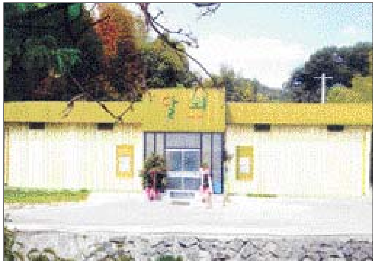
광주 전남 미술계에서 특색있는 전시를 추구하고 있는 소규모 전문 갤러리들이 주목받고 있다. 사진은 달미 미술관(왼쪽)과 지산갤러리 전시공간.