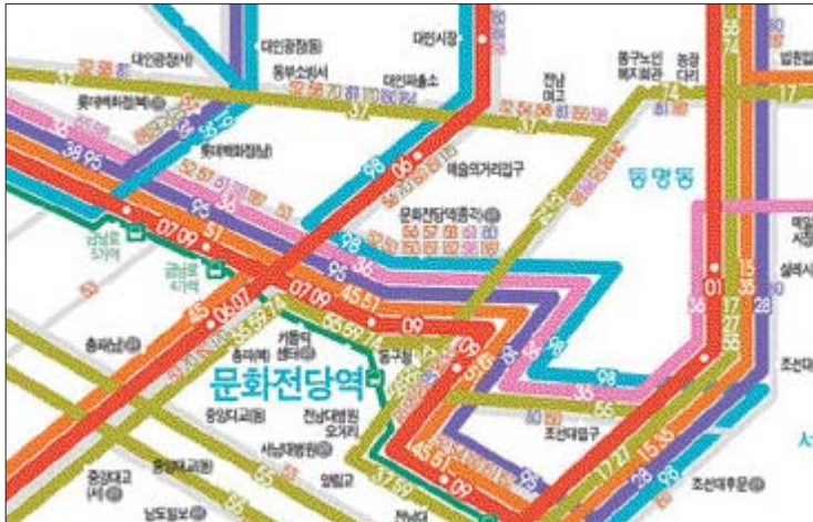
광주 시내버스 노선안내 그림지도.