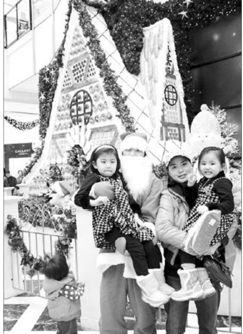
산타와 함께라면... 19일 아이들을 데리고 광주신세계 백화점을 찾은 한 고객이 산타와 기념촬영을 하고 있다. 광주신세계는 백화점 1층 문화광장에서 25일까지 '산타와 함께 사진찍기' 행사를 벌인다.

총제를 즉각 폐지할 것으로 보인다. 기업활동 규제 최소화해 토지이용과 창업 등 규제를 대폭 개혁하고 신규 규제에 대해서는 일몰제를 도입할 예정이다. ◇금융정책=대중 완화해 금융과 산업자본의 분리(금산분리) 원칙도 재검토하겠다는 입장이다. 기업경영에 큰 부담이 되는 노사문제 있어서 무노동·무임금 준수, 불법 노사분규 엄단, 무분규 선언 노사지원 등을 공인하고 있다고 했다. ◇부동산정책=이 당선자의 부동산 정책은 부분적인 규제완화와 공급확대에 초점을 맞추고 있다. 그는 공급 활성화를 위해서는 송과 등 대규모 신도시 개발보다는 뉴타운 등 도심 재개발과 재건축을 확대해야 한다는 입장을 가지고 있다. 또 종합부동산세의 큰 틀은 유지하되 1가구 1주택 장기 보유자에 대해서는 종부세를 완화하고, 양도세 감면과 취득 등록세 인하 등도 추진할 것으로 보인다. 신혼부부에게 1가구 1주택을 공급하겠다는 계획도 있다. 이에 따라 한동안 침체양상을 보이던 부동산 시장은 다시 활기를 되찾을 가능성이 있다. 그러나 부동산시장이 다시 불안한 상황으로 치달을 가능성도 배제할 수 없는 만큼 집권 이후 속도조절이 관건이 될 것으로 예상된다. /이종태기자 jtee@kwangju.co.kr