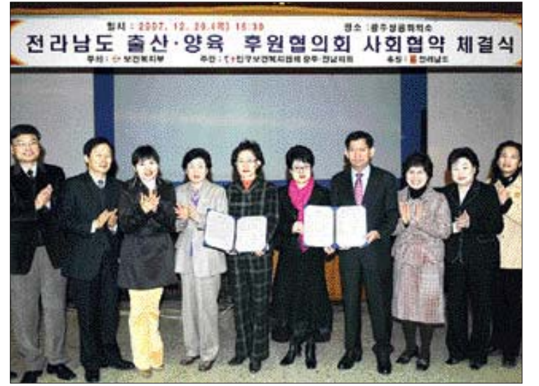
전남지역 15개 기관·단체가 20일 광주상공회의소에서 저출산·고령화 극복을 위한 사회협약을 체결했다.

전남지역의 저출산·고령화 극복을 위해 민·관이 손을 잡았다. 전남도와 전남도의회를 비롯해 지역 의료계와 여성계, YMCA 등 전남지역 15개 기관·단체로 구성된 '전남도 출산·양육 후원협의회(공동의장 황정호)'는 20일 광주상공회의소에서 저출산·고령화 극복을 위한 협약을 체결했다. 지원확대와 ▲아동의 안전한 성장 환경 조성 ▲여성 고용확대 방안 ▲일과 가정 양립을 위한 사회 시스템 구축 등에 나선다. 또 출산·양육을 권장하기 위한 정책 대안을 제시하고 각 직능 단체 별로 구체적인 실천 계획을 마련, 이행 정도를 점검하게 된다.