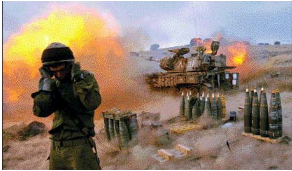
전쟁의 역사는 기술의 발전과 궤를 같이해왔으며, 기술과 변화를 능동적으로 수용했는 지 여부에 따라 승자와 패자로 갈렸다. 이스라엘 포병부대가 레바논 국경을 포격하는 장면.

구원인 저자는 과거 500여년 동안 전개된 전쟁에서 성공적으로 군사혁명을 이룬 국가와 실패한 사례를 통해 교훈을 찾고 있다.