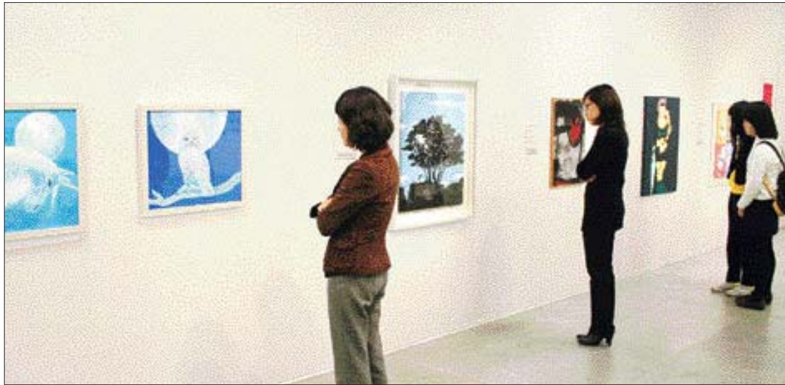
27일 광주신세계갤러리를 찾은 시민들이 신년 소망을 담은 ‘세화전’을 관람하고 있다.