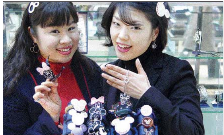
취모양 머리핀 '눈길가네'

롯데백화점 광주점(점장·구수희)이 취모양 머리핀 3일 풍요와 다산을 상징하는 쥐를 캐릭터로 디자인한 머리핀, 잠옷 등을 선보여 고객들의 눈길을 끌었다.