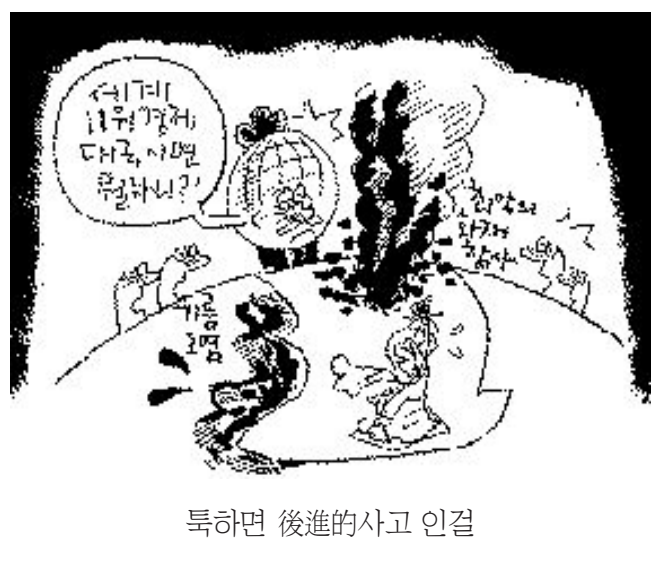
특하면 後進의 사고 연결