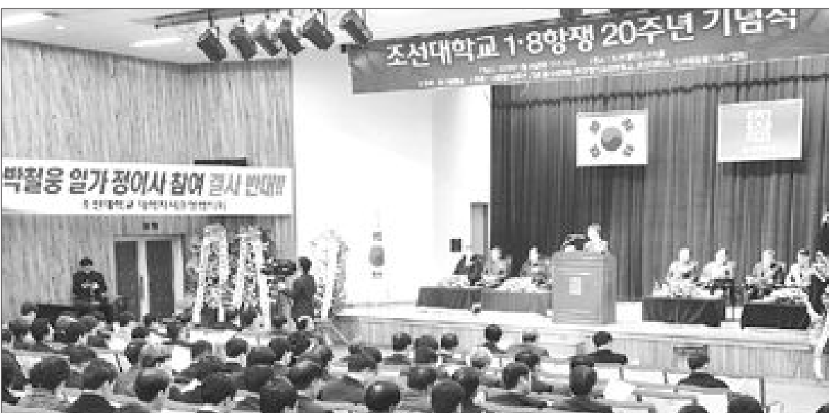
조선대 '1·8항쟁 20주년' 기념식

총리 후보군을 압축할 경우 그간 물망에 올랐던 인사 가운데 이경숙 대통령직인수위원장과 안병만 전 한국외대 총장, 한승주 고려대 총장 등이 우선 거론된다.