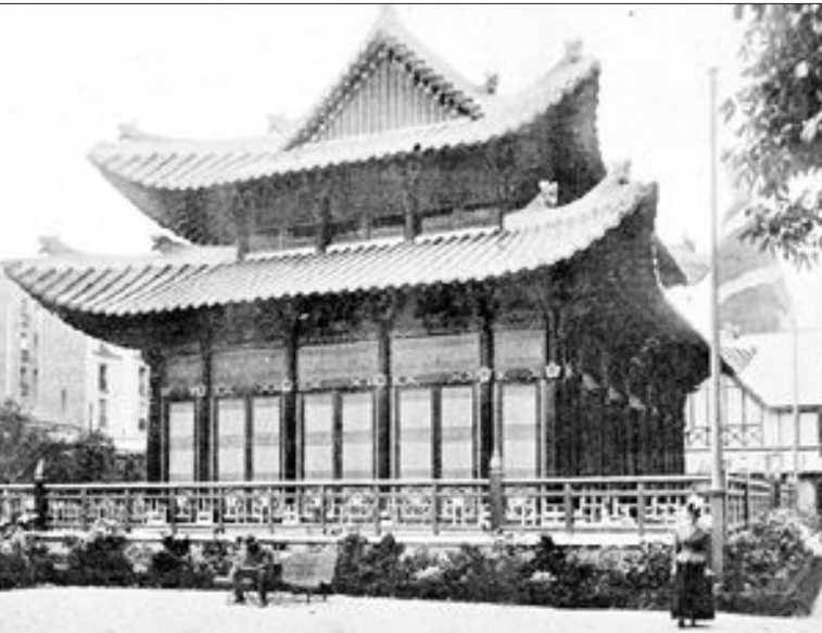
1900년 파리박람회 한국관 사진 공개 8일(현지시간) 공개된 1900년 프랑스 파리 만국 박람회에 설치된 한국관의 사진. 파리에 거주하고 있는 자료수집가인 오영교씨가 최근 20세기 초에 출간된 폴 제르의 책 '1900년'(En 1900)에 게재된 한국관과 전시물 사진을 확보해 공개했다.