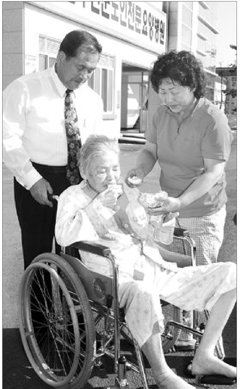
각종 질병에 시달리는 노인들이 늘면서 노인질환을 전문적으로 다루는 전문병원과 요양시설을 설립, 운영하는 지자체들이 늘고 있다. 사진은 공립 무안군 노인전문 요양원에서 생활하고 있는 한 노인.