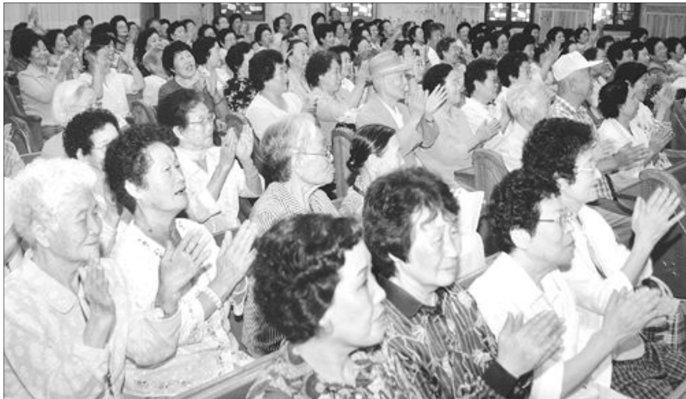
고령화 사회에 접어들면서 노인문제를 해결하기 위한 지자체의 현안으로 일자리 창출, 건강증진 사업 등 수요자 중심의 노인 복지서비스가 부각되고 있다. 사진은 교회 노인대학의 레크레이션 장면.

장률은 32.7%로 전국 평균(56.5%)에 비해 크게 뒤떨어지고 있는 수준이다. 이에 따라 도는 장성군 봉안당, 순천시 화장장·봉안당, 나주시 공설묘지, 광양시 자연장, 고흥군 추모공원 조성, 함평군 봉안당·자연장 등 6개소의 장사시설에 대한 지원을 늘릴 예정이