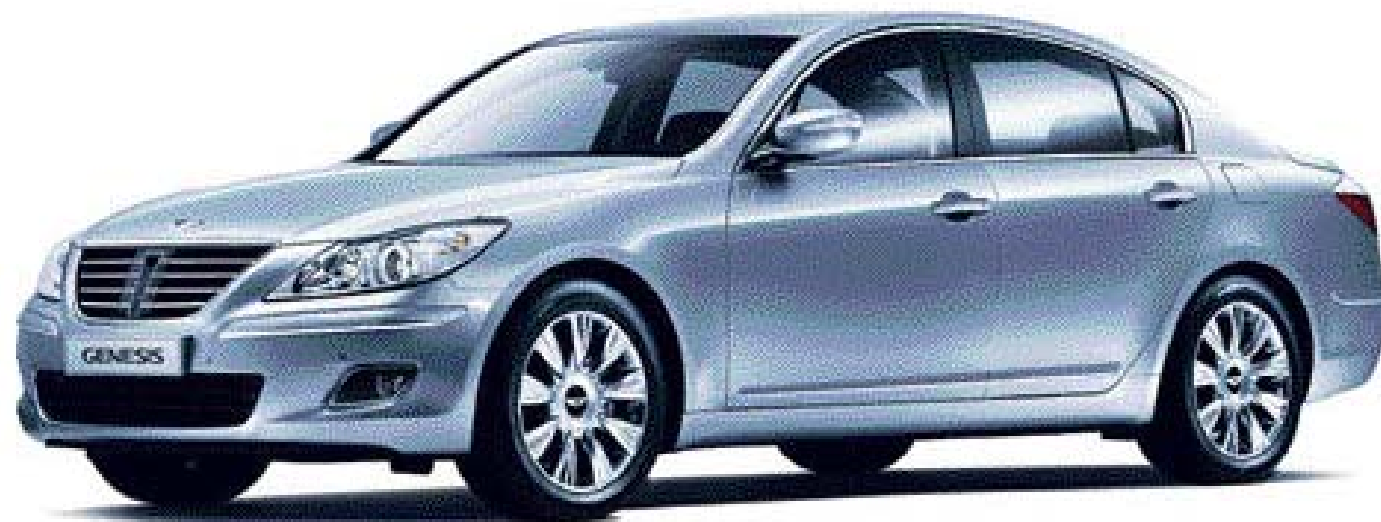
■제네시스 제원 및 가격