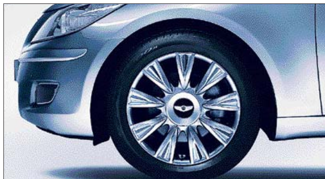
<18인치 타이어 휠>