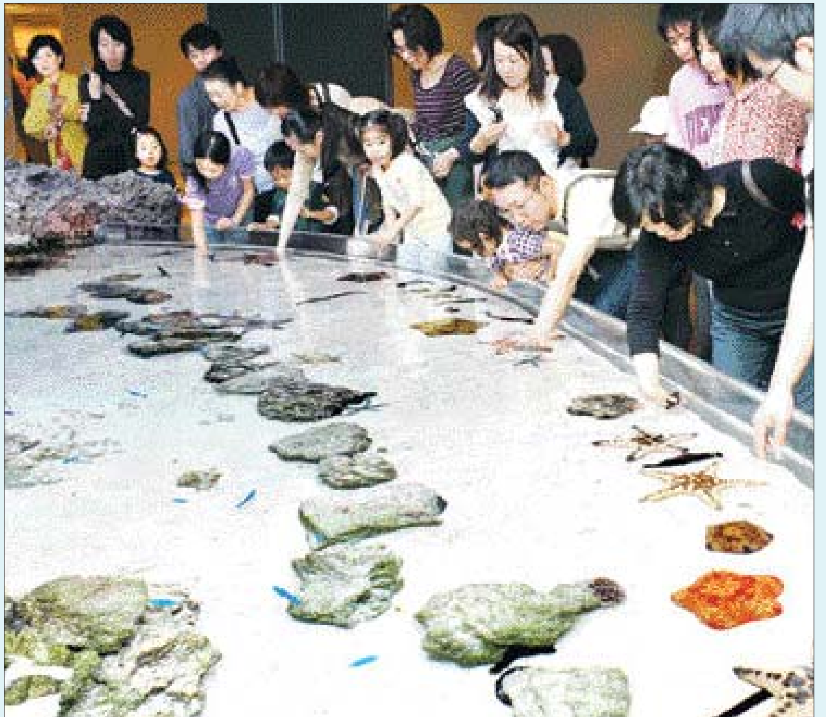
오키나와는 1975년 해양엑스포 개최 이후 활용도를 극대화하기 위해 세계 최대 규모의 츄라우미 수족관 등 다양한 시설을 만들어 운영하고 있다. 츄라우미 수족관에 막 들어서면 만날 수 있는 '터치 풀'에서 관람객들이 오키나와 해양생물을 직접 만져보며 즐거워하고 있다.

/오키나와=박지경기자 unipark@kwangju.co.kr