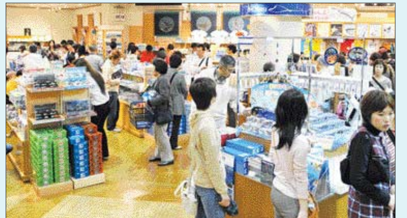
츄라우미 수족관 기념품 판매장. 하루 평균 6천만 원의 매출을 올릴 정도로 인기가 높다.