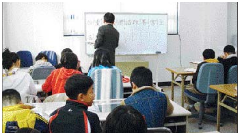
죽교동 '충효한문교실' 개강 목포시 죽교동 주민센터에 충효한문교실이 최근 개설됐다. 죽교동 충효한문교실은 오는 2월 1일까지 30여명의 관내 학생들을 대상으로 한자와 전통문화 교육을 실시한다.

특히 전남 서남권의 새로운 성장 동력으로 떠오르고 있는 조선 산업 활성화를 위한 금융·세계 지원 확대와 고용 확대, 기술개발 등도 차질없이 이뤄질 수 있도록 업계 요구사항을 수렴해 관계 기관에 이를 적극 건의할 계획이다. 주 회장은 "목포상공회의소가 대내외 변화를 순응하고 끊임없는 노력을 통해 회원사의 어려움을 덜어주는 기업 성장의 조력자로서 역할을 다함과 동시에 지역 현안에 대한 구체적이고 효율적인 대안을 제시해 희망찬 서남권을 만들어 나가는데 일조하겠다"고 강조했다.