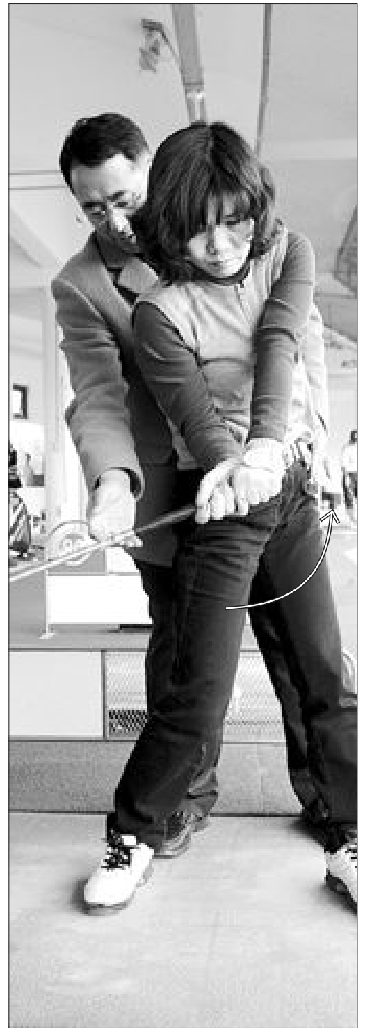
다운스윙은 엉덩이가 회전을 일으키면서 스타트 하면서 팔이 뒤이어 따라 내려오도록 해야만 ‘레이트 히팅(late hitting)’이 제대로 이뤄지게 된다. 교정·지도=김진철 (KPGA 프로)