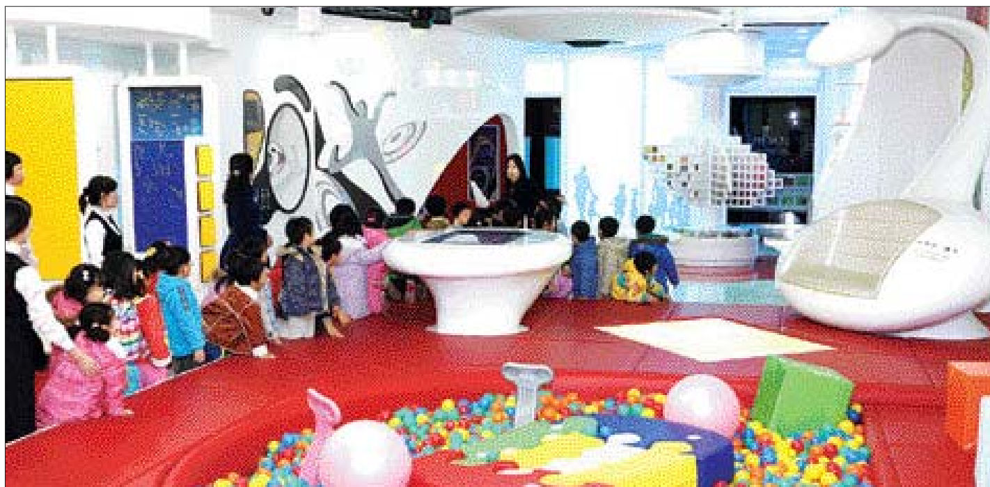
21일 디자인 체험관인 광주디자인센터 디키빌에서 아이들이 디자인 교육을 받고 있다.