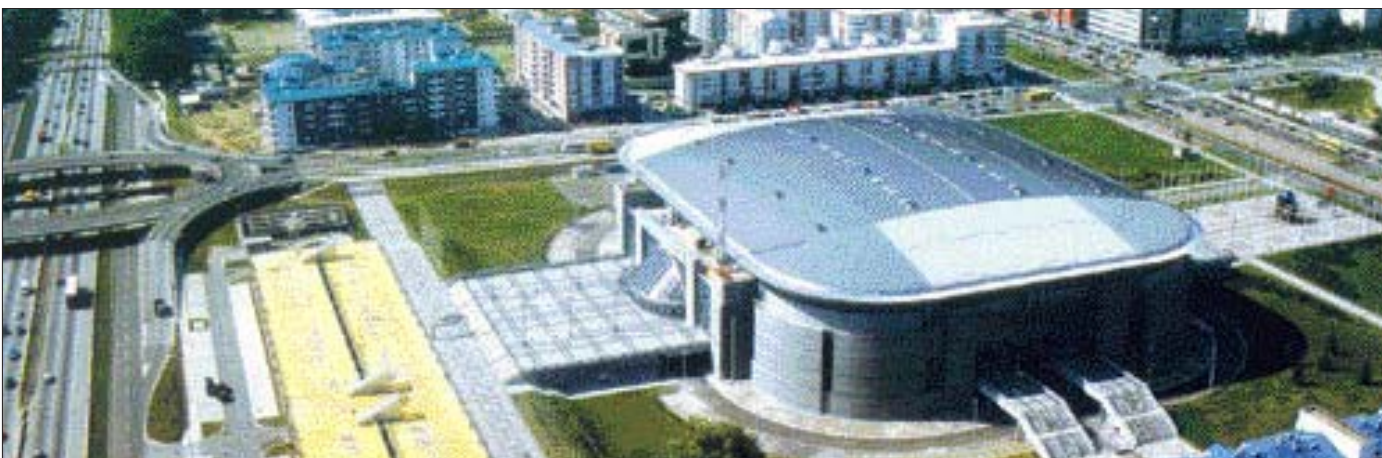
2009년 하계 유니버시아드 대회가 열릴 베오그라드 아레나 스포츠 센터. 4만8천㎡ 규모로 2만명을 수용할 수 있으며, 농구·배구·테니스·복싱 경기가 가능하다.

'UB 2009'는 이렇게 해서 FISU 60년 역사상 가장 성대한 유니버시아드 대회를 치른다는 꿈에 부풀어 있다. 우선 대회 사상 개최 종목이 가장 많다. 정식종목은 육상·유도·축구·체조·농구·펜싱·배구·리듬체조·다이빙·탁구·테니스·수구 등 13개 종목이다. 선택종목으로 태권도·카야·가라데·핸드볼·레슬링·양궁·사격·조정 등 8개 종목도 치러진다.