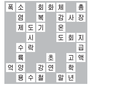
<함께 풀어봅시다 285회 정답>