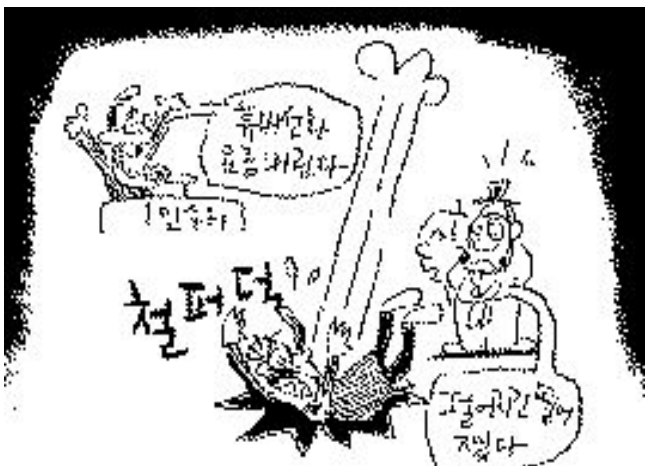
인수위 체면이 바닥에...