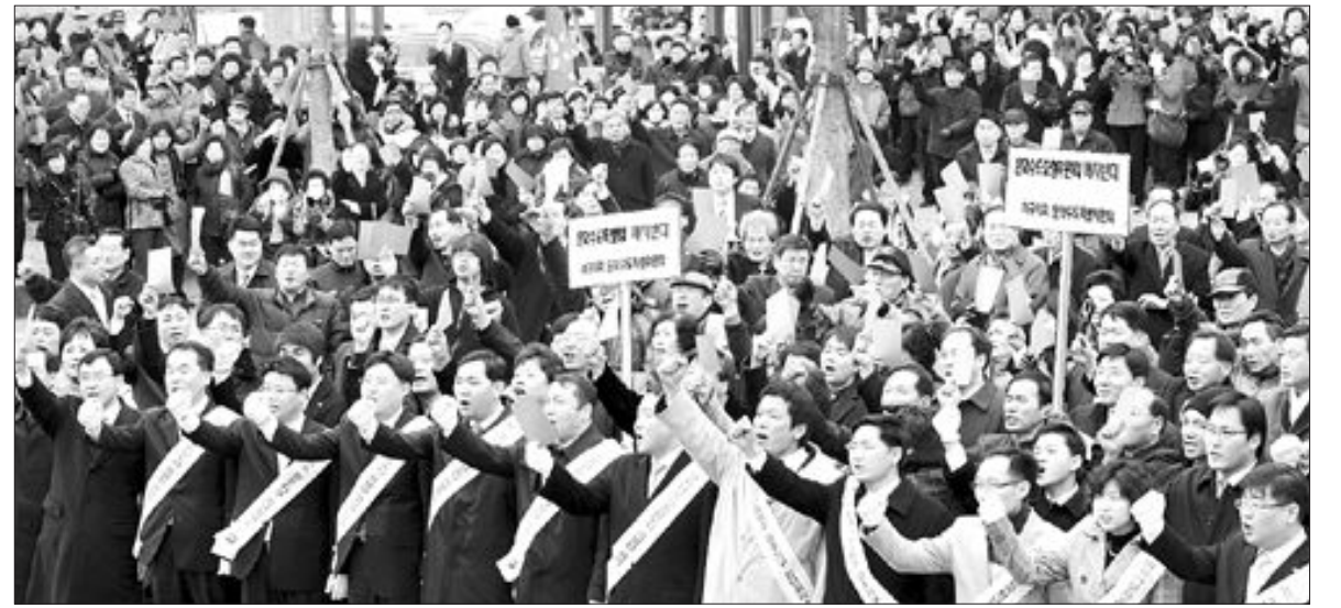
4일 광주시 동구 금남로 민주의 종각 앞에서 열린 '아시아문화중심도시 특별법 개정 반대 범시민대책위원회' 출범식 및 범시민 대회에서 1천여명의 시민들이 '특별법 개정안 철회'를 촉구하고 있다.