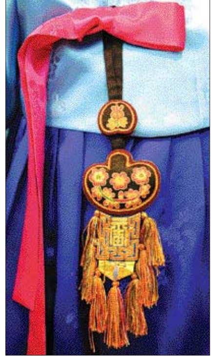
단조로운 한복에 남바위나 배자(왼쪽)를 활용하거나 노리개로 포인트를 주면 한결 색다른 분위기를 낼 수 있다.

울린다. 보통 저고리 색상에 맞춰 노리개를 선택하면 된다. 한복에 구두를 신는 것은 가장 꿀볼걸. 치마 색이 짙다면 어두운 색상의 신발을 택하는 것도 좋다.