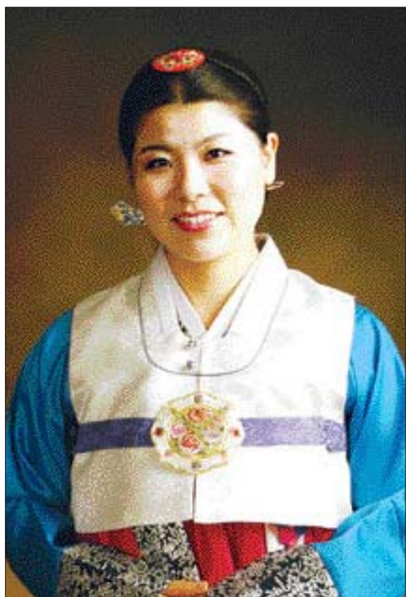
화려한 색의 한복을 입을 때는 맑고 투명하게 화장을 해야 단아하고 우아한 느낌을 살릴 수 있다.

◇한복에 어울리는 헤어스타일=한복에 가장 어울리는 머리스타일은 올린 머리. 앞가르마를 한 머리가 부담스럽다면 자연스럽게 앞머리를 내리고 머리를 땀거나 단정하게 묶어 망으로 머리를 고정시켜 올리면 된다. 꽃이나 머리띠처럼 쓰는 뱀시뿔기 등 한복 장신구를 활용해도 좋다.