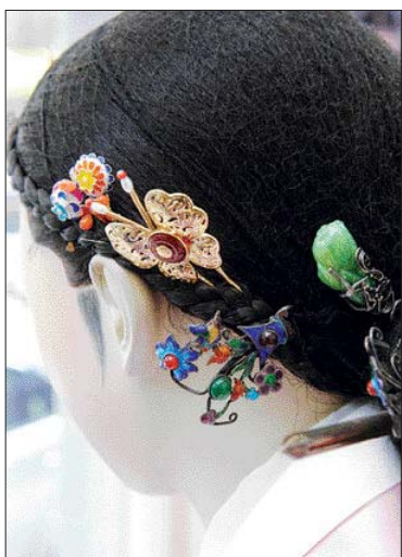
올린머리에 어울리는 뒤꽂이.