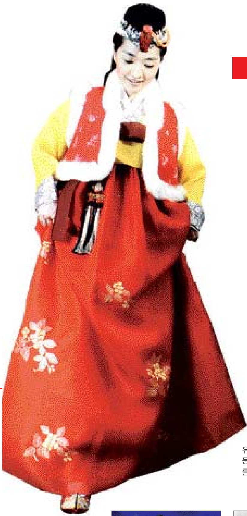
유행 지난 한복에 노리개를 다는 등 작은 변화만 줘도 설날 옷맵시를 살릴 수 있다.