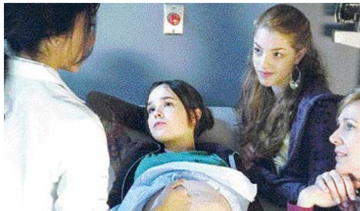
작품상·여우주연상 등 4개 부문 후보에 이름을 올린 영화 ‘주노’