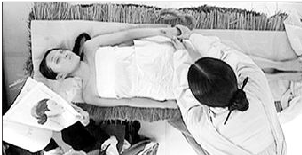
법의학서를 바탕으로 철저하고 치밀한 검사가 이뤄졌던 조선시대 역시 현대 못지 않은 과학 수사의 시대였다. 사진은 조선 시대 수사관들의 활약을 그린 드라마 '조선과학수사대-별순검'의 한 장면.

로 과학적이고 치밀하게 검사를 했다. 뿐만 아니라 검시관의 사전 준비 사항에서부터 검험(檢驗)하는 법, 절차 등이 세세하게 언급되어 있어 당시 수사관들이 어떤 방법으로 검사를 했는지 살펴볼 수 있다. 오래된 시체는 법률(검시에 활용되는 보조 도구)을 활용해 수사를 했다. 순도 100%의 은비너를 활용해 독극물 섭취 여부를 밝혀냈으며 그 밖에 지게미, 초, 파, 소금, 매실 과육은 시신의 상흔을 드러내는 데 사용했다. 또 창출과 조각 등의 약재는 사체가 놓인 곳의 약취를 제거하는 용도로 활용했다고 하니 옛날 사람들의 생활 속에 스며든 과학지식은 가히 놀랍다. 또 목을 매단 끈이나 줄의 탄성도에 따라 스스로 목을 매단 자역(自縊)인지, 살해 후 자살한 것처럼 조작한 조역사(弔縊死)인지를 판별했으며, 칼로 살해 후 불에 타 죽은 것으로 위장을 했는지 범인이 시체의 상처에 초를 발라 상흔을 없앴는지, 끓는 물에 데어 죽었거나 얼어 죽은 경우 등 각 상황에 맞는 다양한 약재와 보조 도구를 사용해 과학적으로 판별했다.