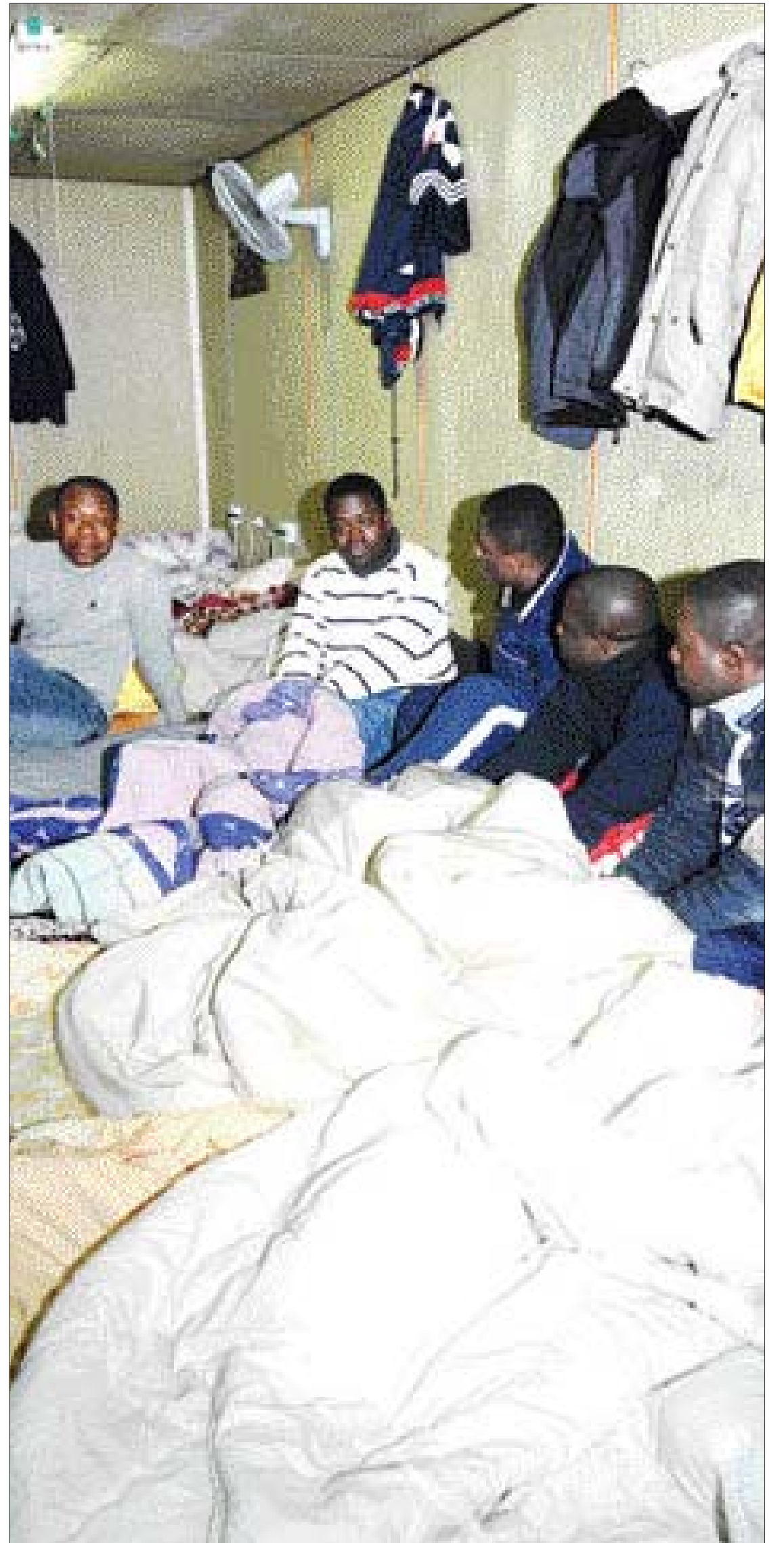
외국인 근로자들에게 겨울은 혹독한 계절이다. 회사로부터 정규 기숙사나 숙소를 제공받지 못하는 외국인들의 경우 컨테이너나 자취방에서 겨울을 나고 있다. 사진은 광주의 한 복지시설이 마련한 컨테이너 숙소에서 생활하고 있는 외국인 근로자들.