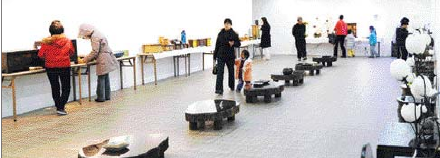
일국도서관은 정기적으로 다양한 내용의 테마전시를 열어 시민들에게 문화향유 기회를 제공하고 있다. 지난 17일 오후 일국도서관 갤러리를 찾은 시민들이 한지공예 작품들을 관람하고 있다.