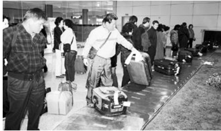
지난 16일로 개항 100일을 맞은 무안국제공항이 입·출국 시스템, 편의시설을 제대로 갖추지 못해 국제공항의 위상을 찾지 못하고 있다. 사진은 도착층의 수하물 컨베이어벨트에서 짐을 찾고 있는 승객들.

또한 국제공항의 기본 요건인 C(세관)·I(출입국관리)·Q(검역) 업무도 광주공항 국제선 인력이 부족하고 있어 국제 항공편이 들어올 때마다 광주공항 CIQ 인력이 출장, 업무를 처리하고 있다. 이로 인해 광주공항 국제선과 시간이 겹칠 경우 새로운 국제 항공편을 취항시킬 수 없게 된다.