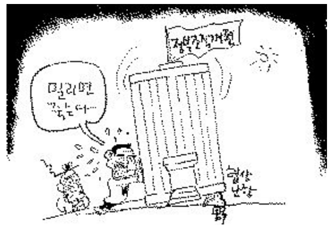
시작도 전에 힘을 너무 뻐다