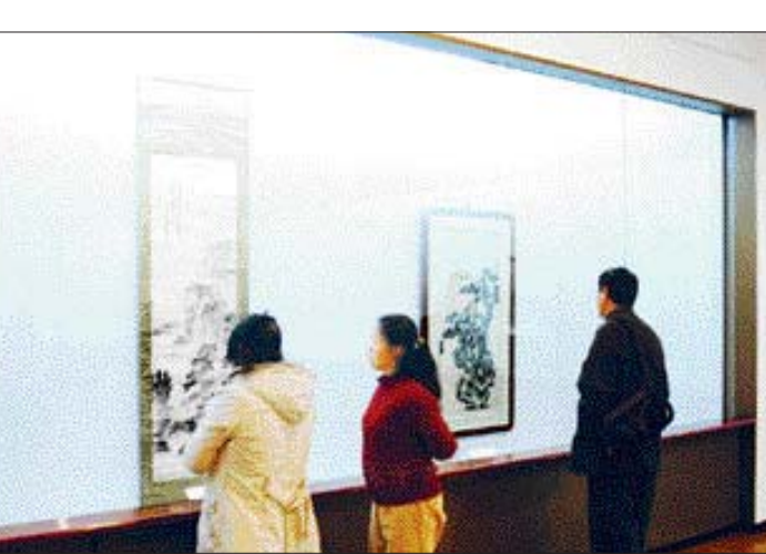
18일 소장품을 재배치한 국립광주박물관 서화실에서 관람객들이 조선시대 서화를 감상하고 있다.

볼 수 있는 기회로 오는 7월에는 조선시대 유명인들이 주고 받은 간찰 120여 점을 모은 전시회를 개최할 예정이다.