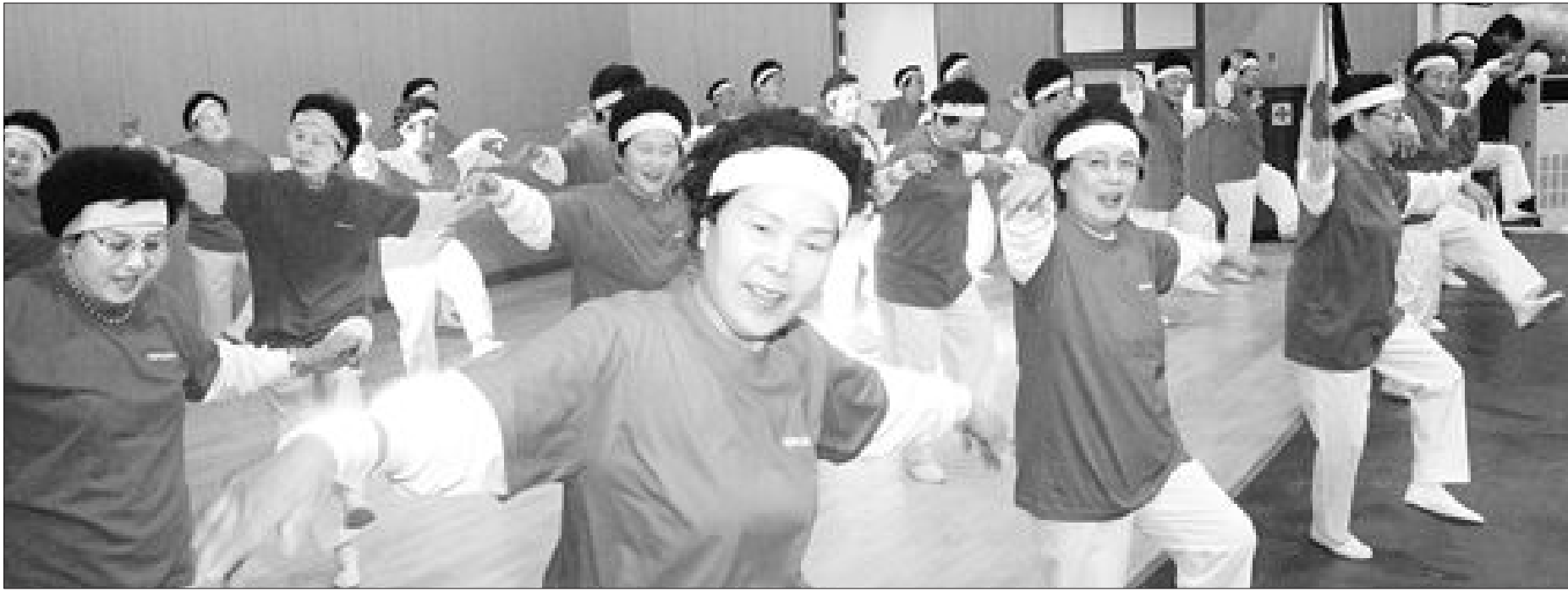
고령이 되면 기초 대사량이 떨어짐에 따라 각종 질병에 노출되기 쉽다. 치명적인 질환인 암 등을 제외하고는 생활습관으로 생기는 질병이 대부분이기 때문에 병을 예방하기 위해서는 철저한 자기관리가 중요하다.