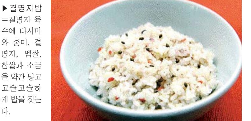
<도움말=김지현 요리학원 정하나 연구원·푸드스타일리스트 정강연>