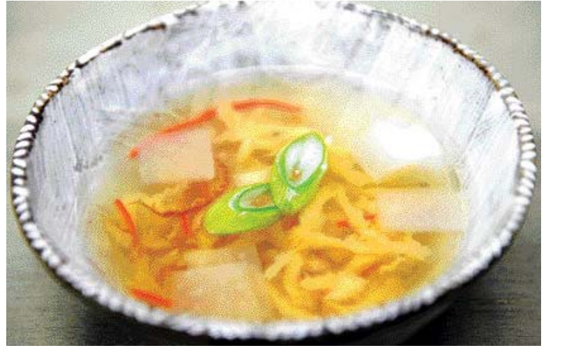
▶결명자 황태우국=①참기름을 두른 변비에 황태채와 다진마늘을 함께 볶다가 결명자 우린물을 붓고 끓인다. ②얇게 썬 무를 넣고 국간장, 소금으로 간하고 채썬 흥고추를 띄운다.

에와 설사를 유발할 수 있으므로 주 의해야 한다. 딱히 부작용은 없으나 속이 냉한 체질은 소화장애와 설사 를 유발할 수 있으므로 주의해야 한 다. 설사가 잦은 사람이나 저혈압이 있는 사람은 피해야 한다. 결명자는 빛깔이 좋아 염색에도 많이 쓰인다. 결명자에 20배 분량의 물을 넣고 60분 동안 2회 반복해서 추출한 액을 염색용으로 사용한다. 황색, 녹색의 색깔을 낼 수 있다. /오광목기자 kroh@kwangju.co.kr