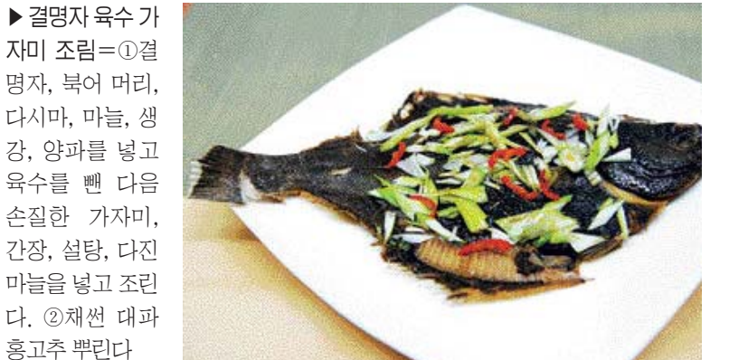
▶결명자 육수 가자미 조림=①결명자, 북어 머리, 다시마, 마늘, 생강, 양파를 넣고 육수를 푼 다음 손질한 가자미, 간장, 설탕, 다진마늘을 넣고 조리한다. ②채썬 대파 흥고추 뿌린다